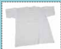
T-shirt av 100% bomull i god kvalitet, den BØR inneholde minst 50% bomull