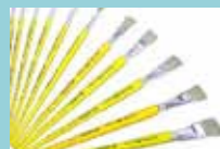
Natur fiber pensler serie 815 og 326