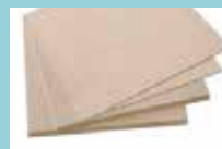
Treplate i MDF eller finerplate ("lerret vårt")