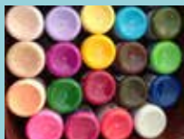
Tekstilmaling fra Acrilex eller annet merke. Acrilex har vært i markedet i over 50 år, jeg har kjent og brukt den i ca 37 år. Du slipper å stryke for å fikse, bare la den tørke 72 timer før du vasker og fargen sitter godt og kan vaskes i vaskemaskin i opptil 40 grader. Fargeekthet er den beste jeg vet om selv vask etter vask.